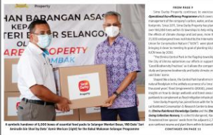
SDPG's commitment to the UNGC - Sime Darby Property Group Berhad (SDPG) has been recognized as a 'Force for Good' by the United Nations Global Compact (UNGC) for its commitment to the Sustainable Development Goals (SDGs).

SDPG is committed to the UNGC and has been recognized as a 'Force for Good' by the United Nations Global Compact (UNGC) for its commitment to the Sustainable Development Goals (SDGs). The company's commitment to the UNGC is a testament to its dedication to sustainable development and its role as a responsible corporate citizen.