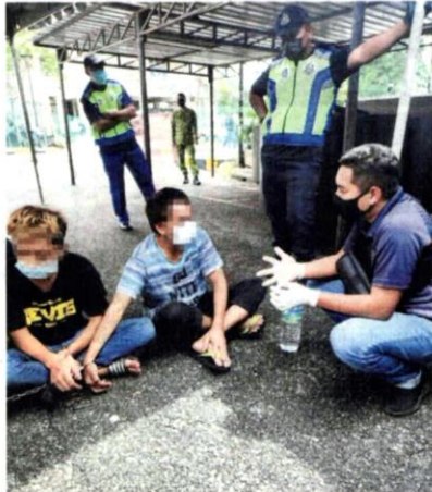
ANTARA penagih dadah sekitar Klang yang ditahan pihak AADK untuk dibantu.