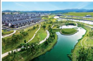
Ekohousing Project (EOP) - Sime Darby Property Group Berhad (SDPG) has been recognized as a 'Force for Good' by the United Nations Global Compact (UNGC) for its commitment to the Sustainable Development Goals (SDGs).

SDPG is committed to the UNGC and has been recognized as a 'Force for Good' by the United Nations Global Compact (UNGC) for its commitment to the Sustainable Development Goals (SDGs). The company's commitment to the UNGC is a testament to its dedication to sustainable development and its role as a responsible corporate citizen.