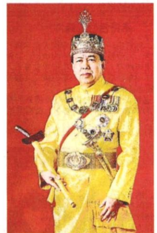
■雪州苏丹沙拉弗丁殿下

他强调,所有受封有功人士的身分和背景,经已获得警方、报穷局及反贪污委员会证实无犯罪记录且身家清白。