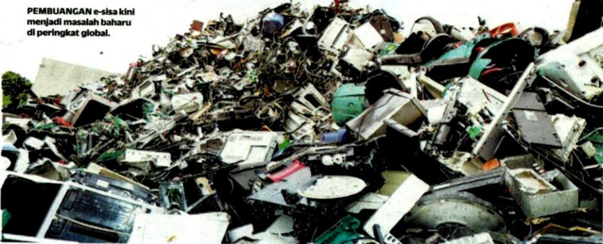
PEMBUANGAN e-sisa kini menjadi masalah baharu di peringkat global.