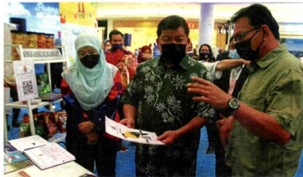
Hee (second from left) visiting one of the exhibition booths at launch of the Pusing Selangor Dulu travel fair and Jelajah Pusing Selangor Dulu 2022 campaign in Petaling Jaya.

fair and Jelajah Pusing Selangor Dulu 2022 campaign at Paradigm Mall.