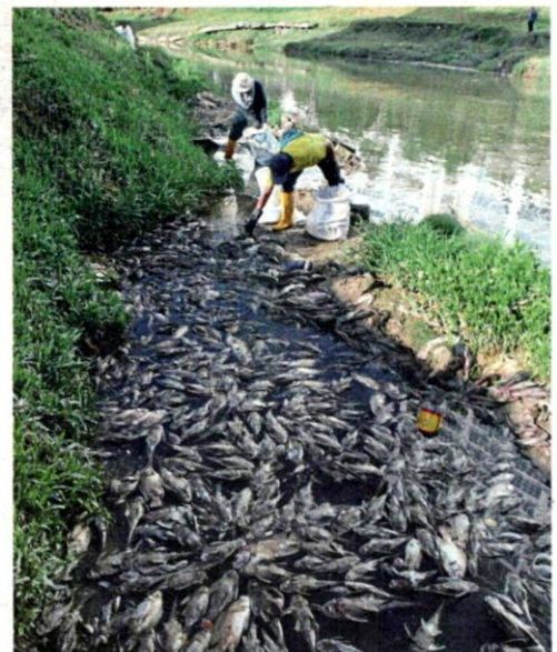
Selangor Drainage and Irrigation Department contract workers removing dead fish from Sungai Damansara in Shah Alam. The incident in June raised concerns on river pollution.

"I have discussed with the state exco members for local councils and housing on introducing rainwater harvesting at certain housing projects, but this requires further considerations due to the extra costs needed for the piping system."