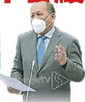
依兹汉：提升巴生河水水质乃刻不容缓，以减低净化水源的各项成本。(视频截图)

他补充，除了滤水站建造工程，还有在河流取水口(muka sauk)之前的上游水质净化工作，这需联邦政府配合。