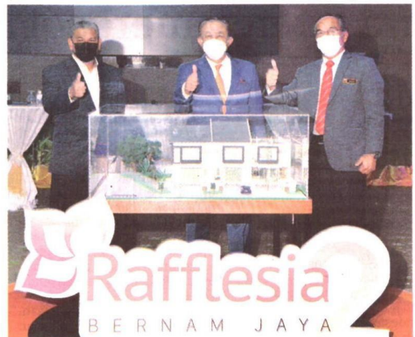
MAJLIS pelancaran projek perumahan Rafflesia 2 Bernam Jaya, semalam.

“Saya yakin, Rafflesia 2 berupaya menonjolkan kemampuan PKNS dalam memberikan peluang kepada pembeli rumah pertama untuk memiliki kediaman menarik dan kualiti binaan yang baik,” katanya.