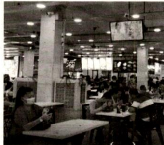
MEDAN selera di Pasar Mahkota Sentral dimonopoli sekali gus menutup sumber rezeki peniaga kaum lain.