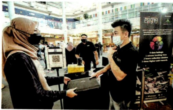
SEORANG pengunjung menghantar barangan elektronik miliknya untuk dikitar semula.